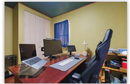
戸建て / K様邸