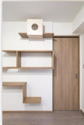
マンション / U様邸