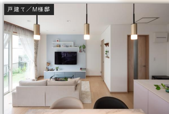
戸建て / M様邸

それぞれのライフスタイル、 ご予算に合わせたリノベーションを ご提案させていただきます。 ぜひお気軽にご相談ください♪