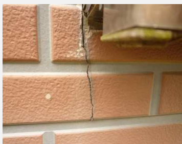
外壁にひびが入っている

外壁は知らないうちに劣化しています。一度じっくりと外壁をチェックしてみてください。