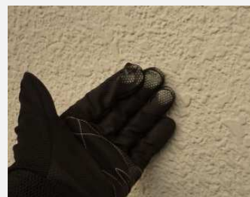
触ると白い粉がつく