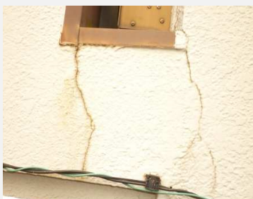
外壁にひびが入っている