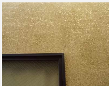
外壁にひびが入っている